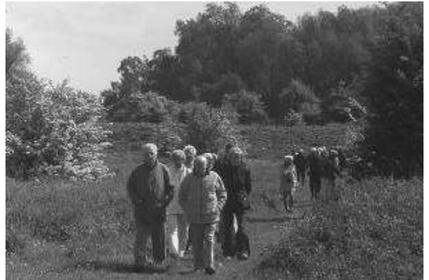
De Blauwe Kamer.

In de Blauwe Kamer is behoefte aan enkele nieuwe vrijwilligers, die excursies van belangstellenden in het gebied kunnen rondleiden en excursievaarten met de Blauwe Bever kunnen begeleiden. Basale kennis van planten en dieren is wenselijk. Wij zoeken mensen, die na een gedegen inwerkperiode het leuk vinden, om zelfstandig in een boeiend verhaal kennis over en begrip voor de natuur over te dragen. De excursies vinden op alle dagen van de week plaats en duren doorgaans 2-2,5 uur. Van gidsen wordt verwacht, dat ze in principe één maal per twee weken een dagdeel beschikbaar zijn. Voor inlichtingen: John Mattheij, telefoon: 0317-613753 of email: johnwilly.mattheij@hetnet.nl.