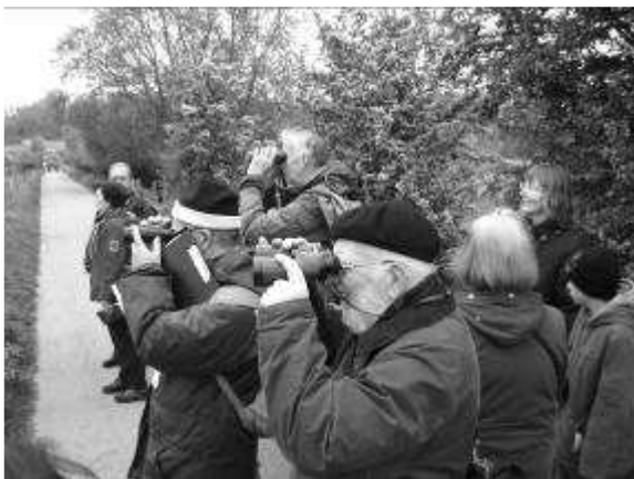
Dauwtrappende vogelaars.

De jubileum-vroege-vogelexcursie op 13 mei was een groot succes. Tanja Otten-Tramper was één van de enthousiaste deelnemers. Ze beschrijft hieronder de ervaringen van haar hele gezin. Ietje