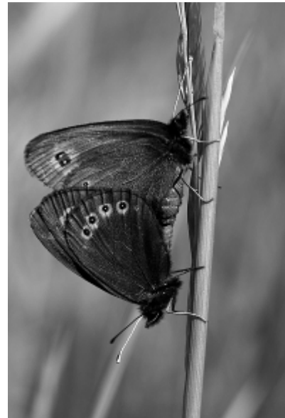
Voorjaars erebia.

Na enig gepuzzel door logistiek organisator Ineke Ammerlaan, werden de 28 campinggasten verdeeld over 7 auto's die - zo goed en zo kwaad als dat soort dingen gaan - in file naar Blankenheim reden. Daar werden we in 2 groepen gesplitst, en bezochten we zowel zaterdag als zondag 2 gebieden. Tussentijds wisselden de groepen van locatie, zodat iedereen dezelfde gebieden bezocht. Dit alles gebeurde onder de zeer deskundige leiding van Chris van