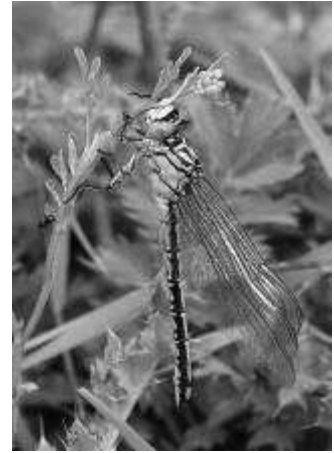
Vrouwtje riverrombout