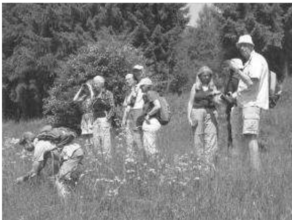
Bermtouristen in de Eifel.

De weergoden waren niet van plan om de bewering van Ineke, dat het begin juni altijd slecht weer is, uit te laten komen, en beloofden plechtig dat het een mooi weekend zou worden. Vrijdag en zaterdag waren zonnig en warm, wat sommige campinggasten ertoe verleidde meteen na de warme autorit verkoeling te zoeken in het nabijgelegen "bergmeer". Hoewel er een poging werd gedaan (door mij) om hier een groepsactiviteit van te maken, waren de meesten toch niet naar de Eifel afgereisd om de waterfauna en flora van dichtbij te bestuderen. Op dat gebied is er mijns inziens voor de KNNV dus nog wel wat werk te verzetten.