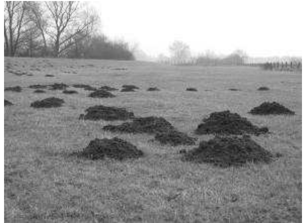
Molshopen in het veld

Mollen graven achter hun prooi, regenwormen en andere bodemdierjes aan. Aan het begin van de winter vluchten de wormen voor de kou, dieper de grond in en de mol graaft er achteraan. Dieper graven van nieuwe gangen levert grond op die ze kwijt moeten. Wanneer het weer warmer wordt, kruipen de regenwormen weer richting aardoppervlak. De mol gaat er ook dan weer achteraan, graaft nieuwe gangen en werpt dus extra hopen op.