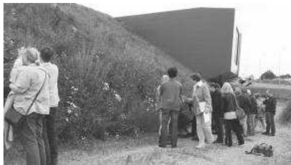
Excursie langs de geluidswal.

batdetectors op zoek gegaan naar vleermuizen. We hebben vier verschillende soorten gezien waaronder de rosse vleermuis, de gewone dwergvleermuis, de laatvlieger en de watervleermuis.