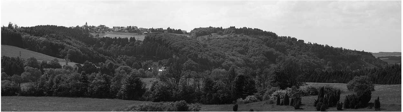
De Eifel.

werd meteen door Chris verboden. Er schijnt in Duitsland een hoge boete te staan op het gebruik ervan.