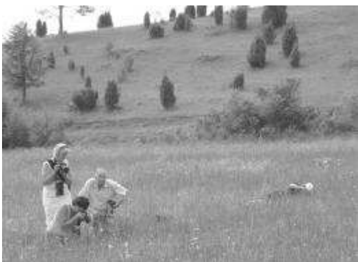
Fotograferen in de Eifel.

De zondagmiddagexcursie viel helaas halverwege in het water omdat we werden overvallen door een gitzwarte lucht. De ene groep kon (ondanks een wat trager lid die niet snapte waarom iedereen zo hard weg holde) toch nog op tijd bij de auto's komen, de andere groep had minder geluk. Ondanks deze afkoeling had iedereen toch nog zin in een ijsje. Vervolgens ging iedereen weer zijn eigen gang. Sommigen bleven nog wat langer nagenieten in de Eifel, maar de meesten keerden voldaan weer huisarts. Kortom, weer een zeer geslaagde activiteit in het kader van het jubileum. Het was echt een feest om in dit mooie gebied te vertoeven. Dank aan Ineke, Irma en Chris voor de voortreffelijke organisatie. En...waarom zouden we nog honderd jaar wachten om weer zo'n geslaagd evenement te organiseren?