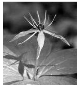
Paris quadrifolia.

zien we bloeiende Eenbes, Gevlekte aronskelk met zijn paarse bloekolf en tenslotte onderaan Daslook. Hier is de ondergrond het meest voedselrijk door de opeenhoping van naar beneden gezakt bodemmateriaal (colluvium).