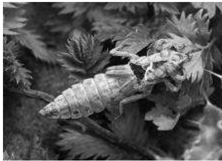
Huid van de riverrombout

De rivierrombout is een zeldzame libel die gebonden is aan schoon rivierwater.