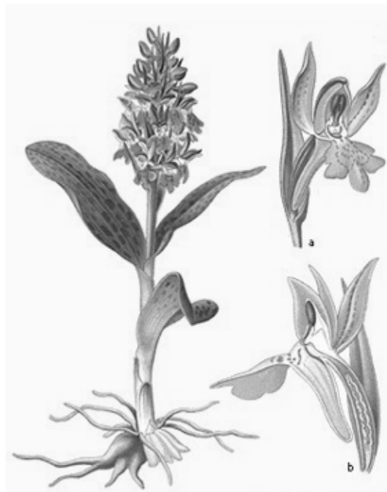
A. Masolef, 1891

Natuurgebieden waar dieren en planten ruimte en rust worden gegeven zullen dus moeten worden gezocht in het landelijk gebied. In Wageningen kunnen we die locaties vinden in het Moftbos of Bennekomse bos, in mindere mate de Wageningse Eng, voorts het Bergbos, de Arboreta, de Uiterwaarden en het Binnenveld.