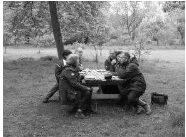
Het ontbijt

vogeltjes uit elkaar', verzucht ik. Misschien tóch een poosje meedraaien bij de KNNV? Ook de poes komt nog even aangehobbeld voor een aai en een hapje. Al met al gaan we verzadigd en tevreden huiswaarts. We willen dan ook alle medewerkers van de KNNV hartelijk bedanken! Wat ons betreft: voor herhaling vatbaar!