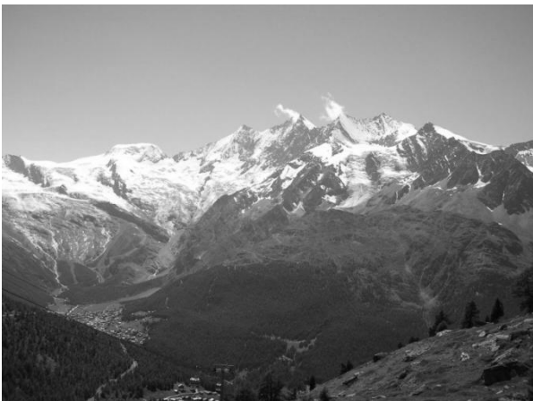
Uitzicht over het Mischabelmassief

Zoals gezegd gaan we meestal naar de wat zuidelijkere dalen. Het weer is daar gemiddeld genomen aanmerkelijk beter dan ten noorden van de grote passen.