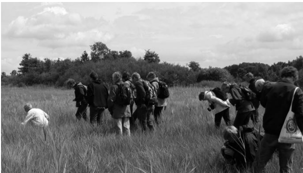
Met de neus in de boter.

Het Binnenveld is van oorsprong een moerassig veengebied met veenstromen, waar kalkrijk kwelwater afkomstig van de omringende heuvels naar de oppervlakte komt. Na de ontginning van het veen werd het gebied geleidelijk geschikt gemaakt voor agrarische activiteit. Aanvankelijk werden de natte en laag gelegen delen van het Binnenveld gebruikt als hooilanden. Omdat het hooi regelmatig werd afgevoerd en er niet werd bemest, verschaalden de gronden. Hierdoor en vooral ook dankzij de kalkrijke kwel, kregen zeldzame vegetaties een kans; zo kwamen in het Binnenveld onder andere blauwgraslanden tot ontwikkeling. In latere tijden werd de invloed van agrarische activiteiten steeds sterker; de gronden werden bemest en de grondwaterstand werd aangepast, d.w.z. verlaagd, door sloten te graven, watergangen te verdiepen en het peil van de Grift te verlagen (de Grift is de centrale waterafvoer van het Binnenveld). Door deze aanpassingen wordt niet alleen oppervlakkig regenwater snel afgevoerd maar ook het grondwater, dat weggevangen wordt in de verdiepte watergangen. Zo werd het ecologisch milieu gemanipuleerd met als gevolg dat in grote delen van het Binnenveld kalkrijke kwel niet meer of nauwelijks nog naar de oppervlakte komt. De effecten op de vegetaties