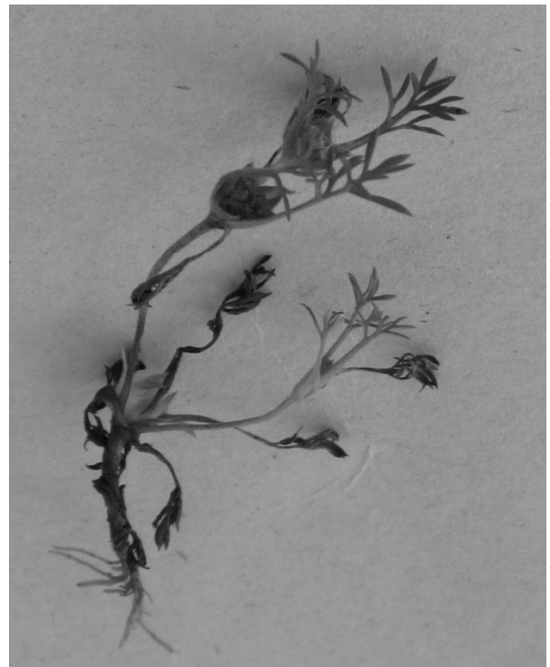
Soliva pterosperma .

Ik had de moed al bijna opgegeven, maar enkele weken na thuiskomst ontving ik inderdaad een mailtje met de bijzondere mededeling dat de lokale kenners ook niet hadden geweten om welke plant het ging. Ze hadden de excursie daarvoor speciaal nog uitgebreid met een bezoekje aan de camping. Uiteindelijk hebben zij via-via kunnen achterhalen dat het ging om Soliva pterosperma (familie Asteraceae, oorsprong Zuid America). Op de Britse eilanden is slechts één andere vindplek bekend, nl op een caravan park in Bournemouth.