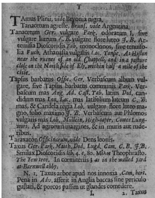
Pagina uit Catalogus plantarum circa Cantabrigiam nascentium

" Soliva is commonly found in watered lawns, golf courses, and hard-packed soils near paths and roadsides of some parts of Europe with increasing infestations in coastal plains. It also produces the sharp seeds, or burs, during the summer which penetrate skin and tires. These seeds are then dispersed by attaching themselves to anyone using these high traffic areas. Human activities are the probable cause of seed dispersal and establishment in areas of maintained recreational use world-wide (Ray 1987)."