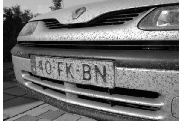
Tel de spetters!

Na de wereldwijde aandacht hebben diverse onderzoeksgroepen uit andere landen contact gezocht omdat ze bijvoorbeeld geïnteresseerd zijn in informatie naar de invloed van wegen op kwetsbare insectenpopulatie. Het blijkt zelfs dat de Splashteller-informatie bij kan dragen aan de rapportage voor de Bern Conventie die de Raad van Europa in 1979 heeft gesloten met als doel het behoud van (met name bedreigde) wilde dieren en plantensoorten. Het verdrag is verwerkt in de Europese Vogelrichtlijn en Habitatrichtlijn, en in de Flora- en Faunawet.