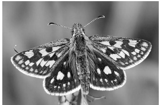
Bont Dikkopje.