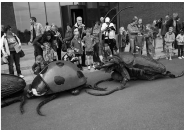
'levensgrote' insecten op de Insectenexperience