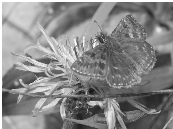
Bruin dikkopje

Een stuk verder gelopen en terug bij de oude mergelgroeve nog een keer naar de dikkopjes gekeken. Nu waren de vlinders veel actiever. Er vlogen meerder bruine dikkopjes, en zeker ook nog één kaasjeskruidkopje. Een mooie afsluiting. Op het terras van het plaatselijk café nog een drankje genuttigd en Aart bedankt voor de perfecte organisatie. Voldaan en goedgezumt zijn we huiswaarts gekeerd.