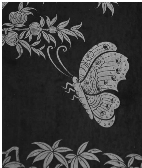
Vlinder in Bangkok National Museum

Wie zijn of haar portie nog niet gehad heeft, kan de bodem verkennen of volgend jaar meedoen aan de inventarisaties langs de Grebbenlinie en de Schoutenwaard. Mijn aandacht gaat voorlopig uit naar stoplichten en sneeuwbes plantsoen. Je weet nooit wat je kunt verwachten. Hoop doet leven!